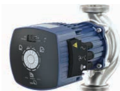
CalioTherm Pro mit Gewindeanschluss

Einsatzgebiete: Trinkwasser-Zirkulationssysteme Weitere Informationen: www.ksb.de/produkte