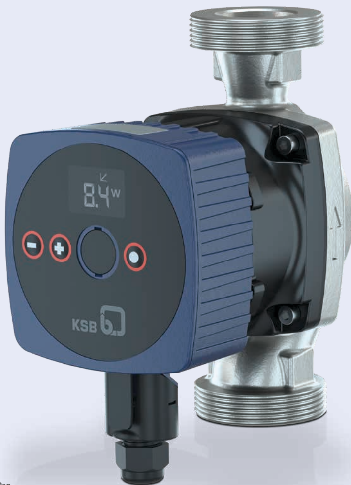
CalioTherm S Pro

Einsatzgebiete: Trinkwasser-Zirkulationssysteme in Einfamilienhäusern